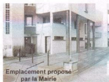
Emplacement proposé par la Mairie

Puis, plus rien jusqu'en février où nous apprenons qu'il ne s'agit plus d'un projet, des travaux vont démarrer, à l'endroit indiqué sur la photo