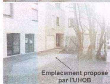
Emplacement proposé par l'UHQB

Refusant que le Routoir soit "défiguré" par ce projet, l'UHQB a proposé de créer cette place dans la cour, derrière le PAJ,