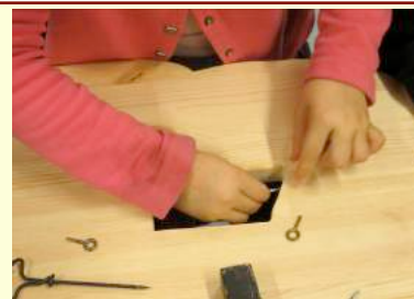
Ils ont aussi poncé avec du papier de verre, collé, vissé...