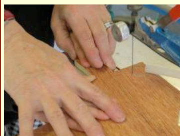
Une scie à chantourner

Cette année, les élèves de Grande Section travaillent sur le thème de l' Arbre . Plusieurs sorties ont déjà eu lieu, toutes encadrées par les animateurs du Centre Initiation à la Nature et à l'Environnement : arboretum du campus, Rochasson... Des arbustes ont également été plantés à proximité de l'école avec l'aide des Espaces Verts de la commune de Meylan. Des animatrices de l'atelier "La Passion du Bois" sont intervenues récemment dans l'école pour travailler avec les élèves. Ces derniers ont pu voir et utiliser différents types d'outils pour travailler le bois et... fabriquer un arbre à sons !