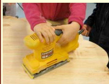
Une ponceuse électrique