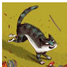
Le chat tigré