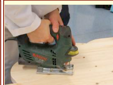
Une scie sauteuse