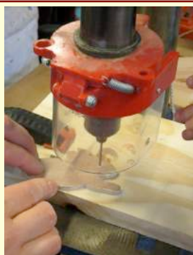
Une perceuse à colonne