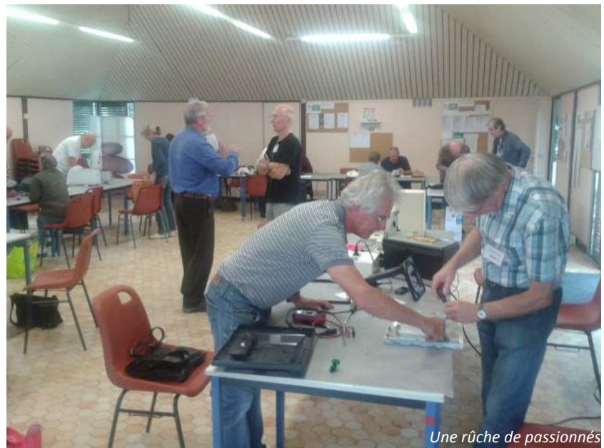
Une ruche de passionnés