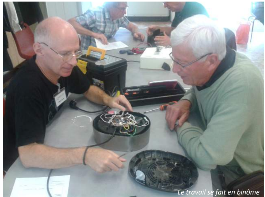
Le travail se fait en binôme

Trois personnes de Montbonnot se sont déjà proposées en toute amitié pour nous aider à reproduire ce savoir-faire dans le quartier, il suffirait de 4 ou 5 habitants qui aient déjà beaucoup "regardé comment ça marche" pour démarrer modestement cette activité conviviale. Si le cœur vous en dit, vous pouvez nous contacter à uhqbcontact@gmail.com .