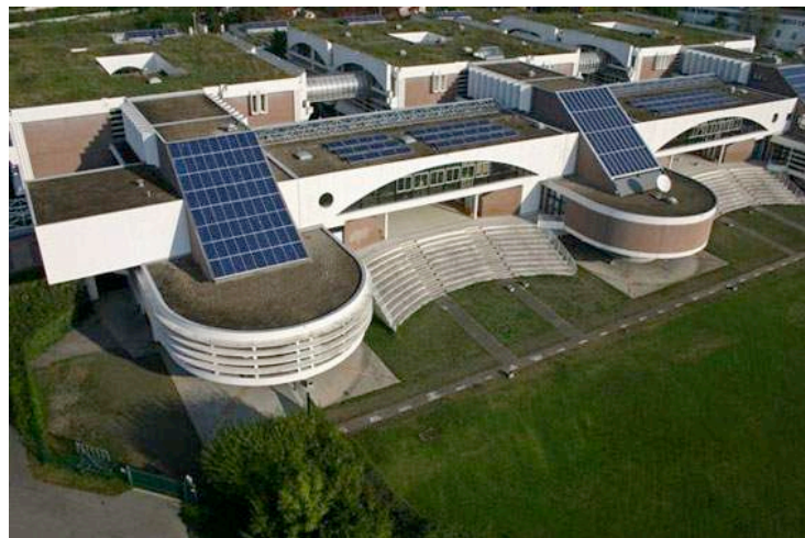
Parc photovoltaïque français raccordé au réseau géré par ERDF

Le constructeur s'est engagé sur une production annuelle minimale de 50 000 kWh/an. Le 17 septembre 2014, soit après 10 ans de fonctionnement exactement, la centrale avait produit 529 103 kWh soit une moyenne annuelle de 52 910 kWh. Le kWh produit est facturé 17 centimes d'euros à ERDF avec une réactualisation annuelle. Il est possible de suivre la production en temps réel : solaire.lgm.acgrenoble.fr