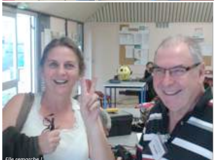
Elle remarque !