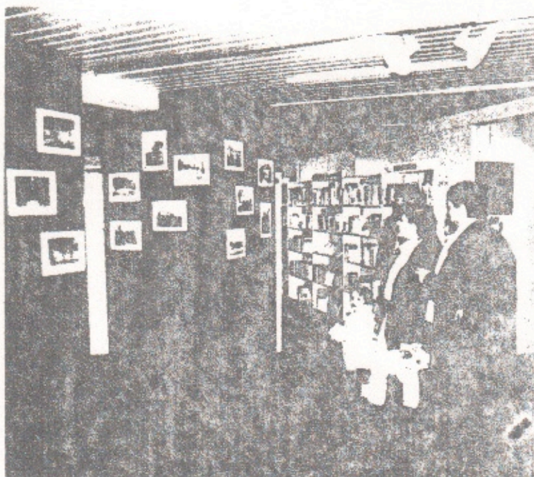
"Ouverture Exposition Photo"