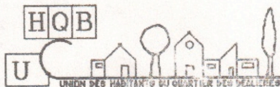
PHOTO CLUB BEALIERES