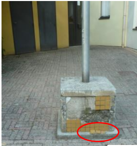
Les habitants font la collection des petits carreaux jaunes