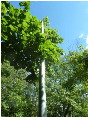
Les lampadaires marchent –ils tous ? Lampadaire... sans lampe ...et 2 lampadaires arrachés le long du Chemin des Béalières à remplacer.