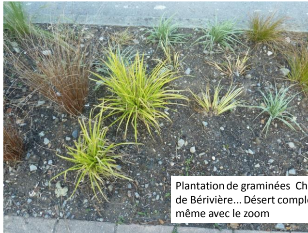
Plantation de graminées Chemin de Bérivière... Désert complet même avec le zoom

Point critique 15 : Eviter les graminées qui ne font pas de fleurs (c'est mauvais pour les abeilles)