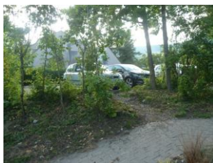
Levée de rideau sur les voitures après coupe sévère chemin de Bérivière

Point critique 16 : Eviter les coupes sévères qui détruisent le paysage