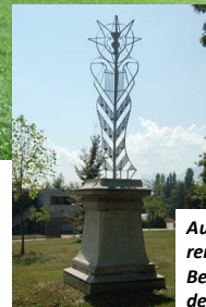
Au fait, et si on remettait la statue de Berlioz avec son socle de 1903 quelque part ?