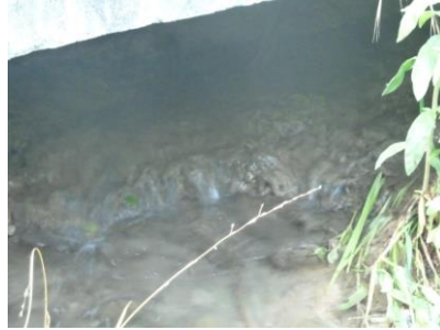
Barrage d'eau par concrétion