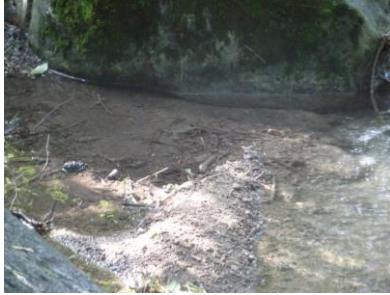
Barrage d'eau par la terre

Exemple du ruisseau côté parc du Bruchet :