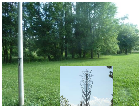
Réduction drastique de l'ombrage parc du Bruchet