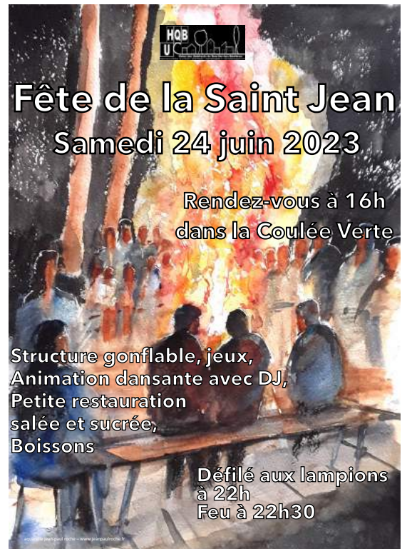
Aquarelle : Jean-Paul Roche