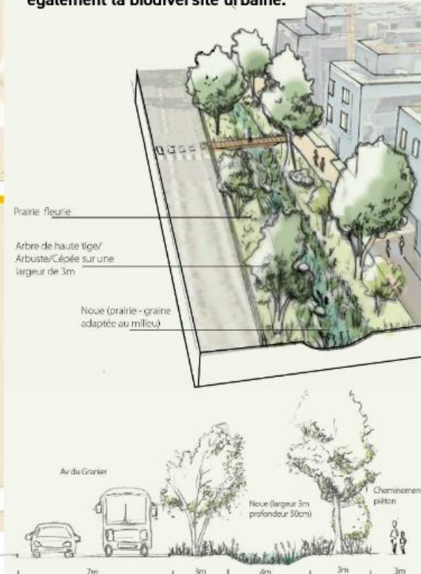
Plan de coupe

Sorte de petit fossé végétalisé avec des pentes douces, la noue recueille l'eau de pluie et de ruissellement pour la laisser s'infiltrer et ainsi reconstituer les nappes phréatiques et éviter l'assèchement des sols. Elle favorise également la biodiversité urbaine.