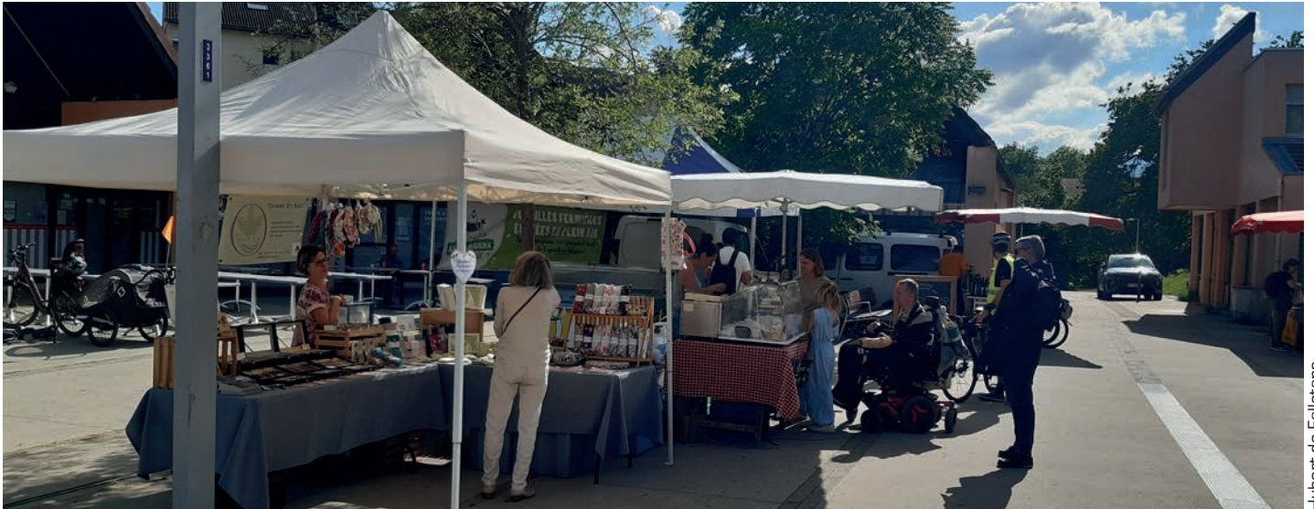
Hubert de Falletans