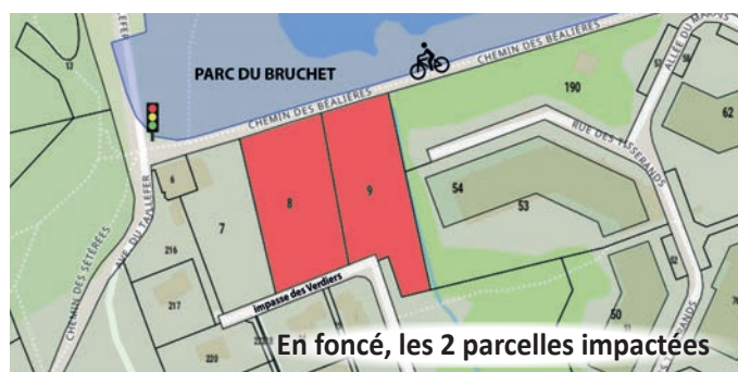
En foncé, les 2 parcelles impactées

D epuis quelque temps, les vautours s'intéressent à un grand terrain situé le long de la Chronovélo, au niveau de l'avenue du Taillefer sous le Parc du Bruchet. Par vautours, nous entendons promoteurs immobiliers qui se frottent les mains