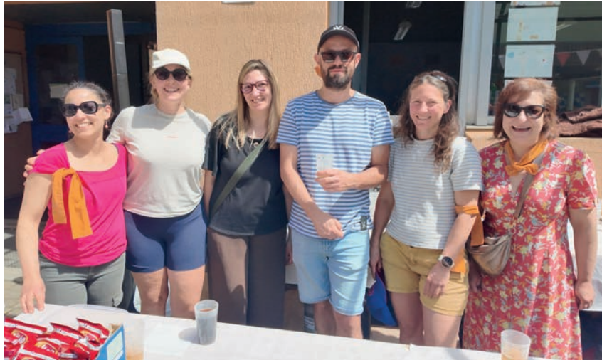
Sou des Béalières

La tenue d'un vide-greniers le 26 avril dans la cour de l'école était une première : vêtements, jouets, livres et petite décoration ont rencontré leur public sous un soleil de printemps. Le Sou des écoles remercie chaleureusement les personnes qui ont réservé un stand et l'ensemble des visiteurs qui ont contribué à la réussite de cet événement.